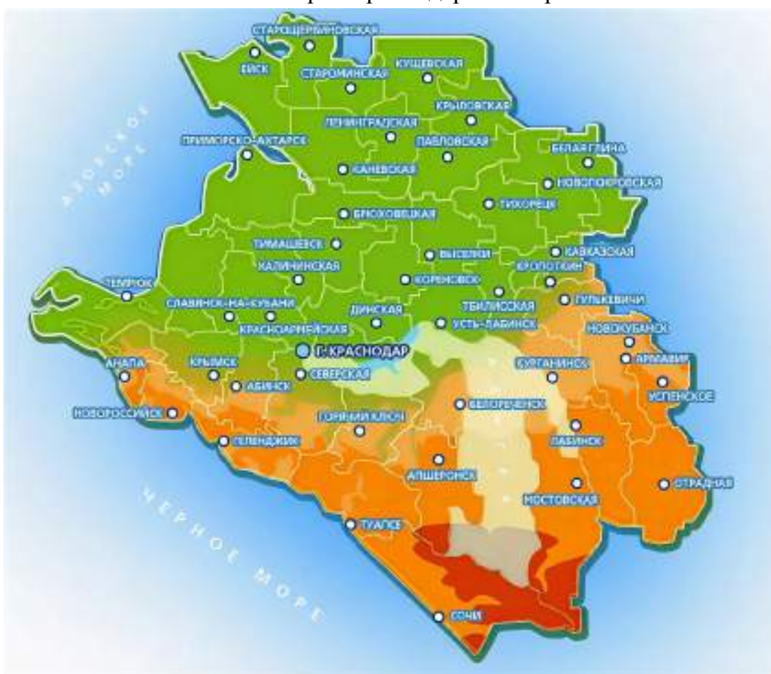
Листы для выполнения практического задания «Вид из твоего окна»